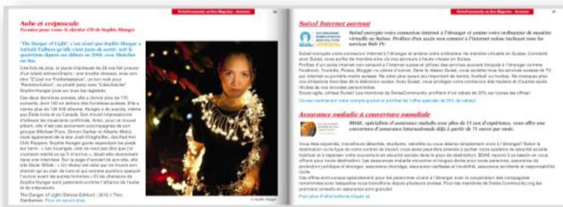
Capture d'écran 4 : offre spéciale dans le SC-OnlineMagazine