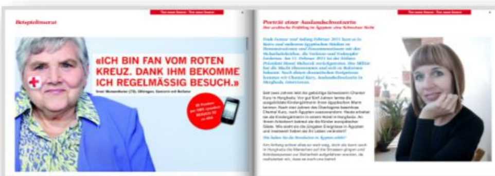
Capture d'écran 5: annonce dans SC-OnlineMagazine

Texte: max. 600 caractères* ; max. ¼ de l'annonce