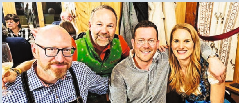
Gruppenfoto nach dem Essen.