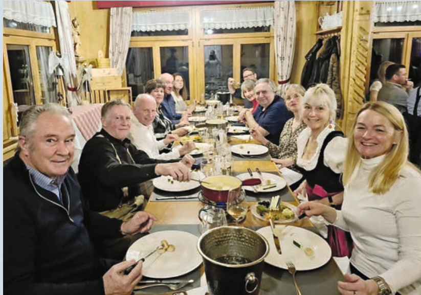
Ein perfekter Fondue-Abend.

Auch dieses Jahr lud der Schweizer Verein im Fürstentum Liechtenstein zum Fondueabend ein. 53 Mitglieder inkl. 9 Kinder trafen sich am 6. Februar im Restaurant Vögeli im Malbun. Der Abend fand wiederum unter dem Motto «Nacht in Tracht» statt. Dementsprechend kleideten sich viele Mitglieder im schönen Dirndl und in schöner Tracht. Für die zum Motto passende Kleidung gab es einen Preisnachlass bei den Kosten für das Fondue und die Differenz wurde vom Schweizer Verein übernommen.