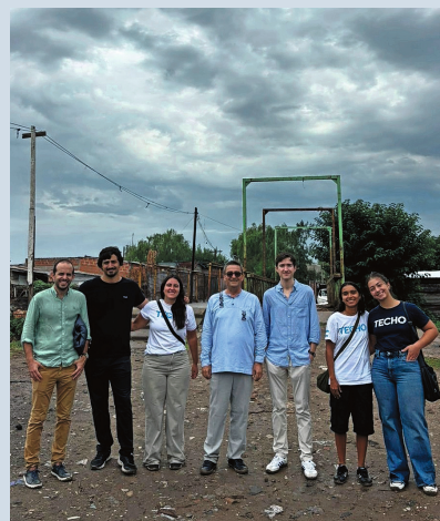
Embajador de Suiza junto a referentes locales

El Embajador y su equipo pudieron conocer de primera mano las difíciles condiciones de vida de los vecinos y vecinas del barrio de Quilmes y destacaron el esfuerzo de voluntarios y voluntarias de TECHO y Treeple junto a la comunidad para crear un espacio recreativo, público, seguro y accesible a la comunidad.