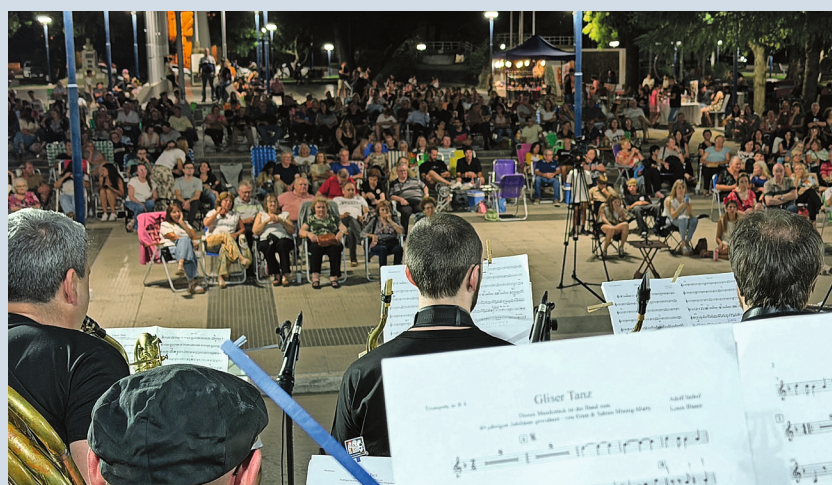
Concierto en la Plaza Libertad de San Jerónimo Norte

gentina, ya que en el S. XIX muchas familias del Cantón de Valais encontraron una nueva patria en esta región. La gira, titulada "Un puente musical entre Suiza y Argentina", tuvo como objetivo retomar relaciones históricas y promover el intercambio artístico y cultural, celebrando el jazz como lenguaje universal.