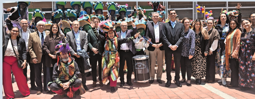
Embajadores de las representaciones diplomáticas y entidades distritales en el Primer Festival Gastronómico de la Francofonía