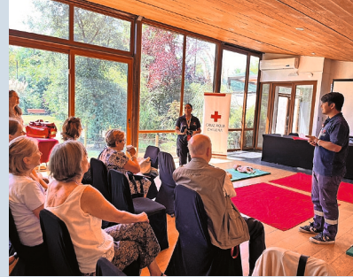
Introducción a los programas y líneas de acción de la Cruz Roja Chilena

Estas iniciativas se enmarcan en una proyección de trabajo conjunto entre la Cruz Roja Chilena, el Club Suizo de Santiago y YPSA-Chile, orientada al desarrollo de acciones en los