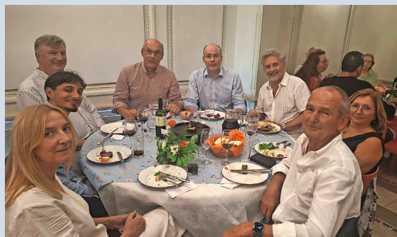
Visita de dos exembajadores de Suiza en Uruguay y del actual embajador

Estas instancias, sencillas y a la vez significativas, reafirman el valor del Club Suizo de Montevideo como espacio de