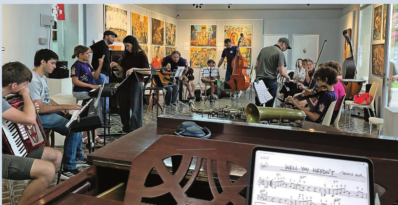
Taller con los niños de la Fundación Arte Viva

anfitrionas. El gran trabajo previo logró que el encuentro y la comunicación fluyeran naturalmente.