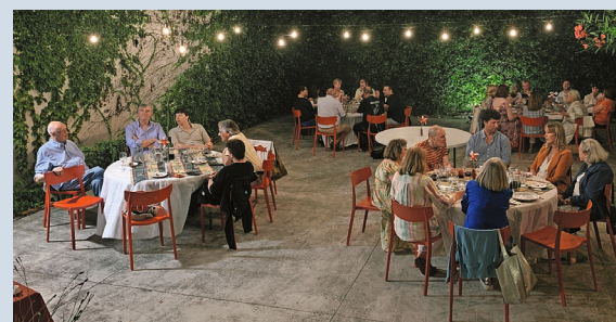
Cena al aire libre

encuentro, memoria y continuidad de las tradiciones que nos vinculan con Suiza.