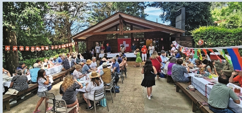
Vista general del almuerzo