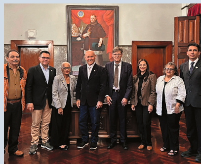
Izquierda: Embajador Giles Roduit y artistas en el marco de la Exposición