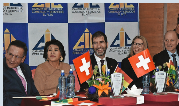
Delegación suiza en la CAINCO El Alto

como el Grupo Doppelmayr Garaventa y Fatzer del Grupo Brugg. Asimismo, la agenda de la visita incluyó la realización de las primeras consultas políticas y económicas entre ambos países, lo que constituye un paso signi-