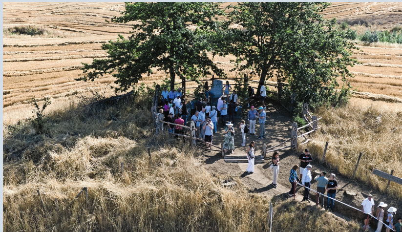
Visita al monolito que recuerda la llegada de los colonos suizos a Quechereguas

Cerrando la jornada, tomaron la palabra los representantes de cada mesa fa-