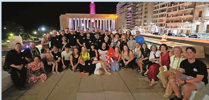
Momento posterior al concierto en el Monumento a la Bandera (Rosario)