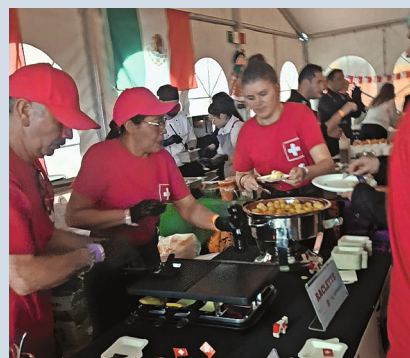
Derecha: Stand de Suiza con platos tradicionales de la gastronomía helvética