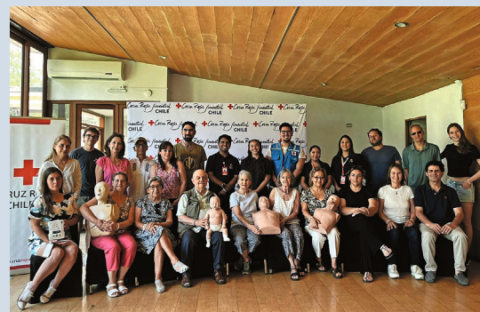
Representantes de la Cruz Roja, YPSA y Club Suizo

Durante la primera parte del encuentro se presentó la labor que desarrolla la Cruz Roja Chilena, sus principales líneas de acción y enfoques de trabajo, así como el rol que cumple en la prevención, la educación comunitaria y la