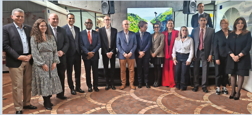
Embajadores y representantes de instituciones de la Francofonía en el Colegio público IED La Candelaria