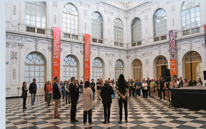
Inauguración de exposición 'El pensamiento es un jardín híbrido', Museo de Arte de Lima

edificios de departamentos e incluso el diseño de un cine. Por su parte, la muestra "El pensamiento es un jardín híbrido", exhibida en las salas de dos importantes museos de Lima: Museo de Arte Contemporáneo -MAC Lima- y Museo de Arte Lima -MALI-, propone un recorrido por obras que, de manera pionera, articulan los vínculos entre arte, tecno-