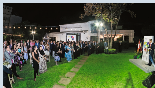
Recepción de la Francofonía en la residencia del embajador