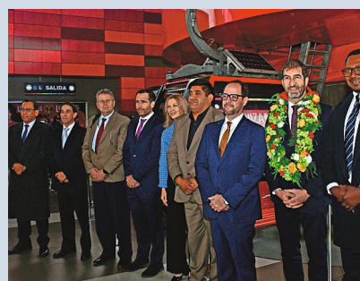
Izquierda abajo: Lanzamiento de los 80 años de relaciones diplomáticas, acto en el teleférico