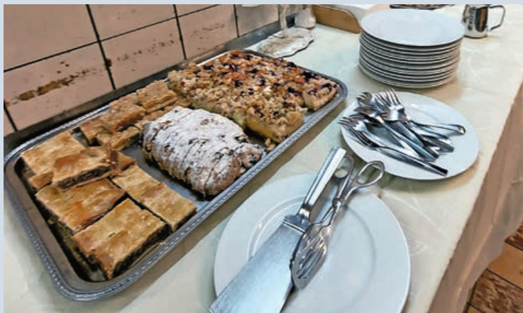
Osnabrücker Schweizer in der Weihnachtsbäckerei

Im Schweizer Verein Osnabrück ist immer etwas los – und genau das macht unseren Verein so besonders. Aktuell zählt der Verein 62 Mitglieder, von denen rund 25 bis 30 regelmässig aktiv am Vereinsleben teilnehmen. Gemeinsam pflegen wir ein Stück Schweiz mitten im schönen Osnabrücker Land – mit viel Humor, Geselligkeit und natürlich gutem Essen.