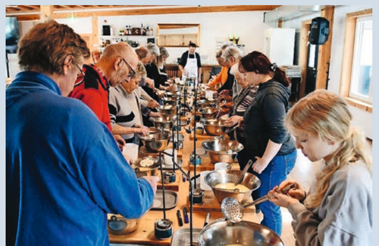
Die Kursteilnehmer beim Abschöpfen der Gallerte