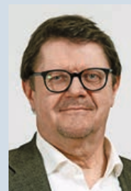
IVO DÜRR, REDAKTION

Tatsächlich hört man allenthalben, dass auch Mitglieder der lancierenden Partei nicht besonders glücklich mit der Formulierung sind. Die Wahrscheinlichkeit, dass die Initiative vom Stimmvolk «versenkt» wird, scheint zwar derzeit gross. Dennoch, das Thema ist auf dem Tisch, ist brisant und sollte zum Nachdenken anregen. Denn auffallend ist auch, dass die Argumente dagegen überwiegend ökonomischer Natur sind, die psychologischen Faktoren jedoch oft ausgeblendet werden: Viele Schweizer fühlen sich zunehmend unwohl: 2024 lebten in der Schweiz etwa 2,3 Millionen Menschen ohne Schweizer Pass, also rund 26,4 Prozent. Damit gehört die Schweiz in Europa zu den Ländern mit dem höchsten Anteil an Ausländern. Dieses «Unwohlsein», der Eindruck von knapper werdendem und immer weniger leistbarem Wohnraum, überfüllten öffentlichen Verkehrsmitteln und zunehmender Konkurrenz am Arbeitsplatz ist nicht subjektiv, sondern evident! Das sollte auch in den Schweizer Bel Etagen, Wandelhallen und Direktionsetagen ernst genommen werden, bevor die Stimmung kippt, was wir in anderen Ländern täglich erleben.