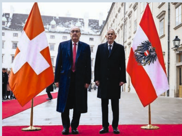
Bundespräsident Guy Parmelin und Bundespräsident Alexander Van der Bellen

Bei den europäischen Themen informierte er seine Gesprächspartner über die nächsten innenpolitischen Schritte im Zusammenhang mit der