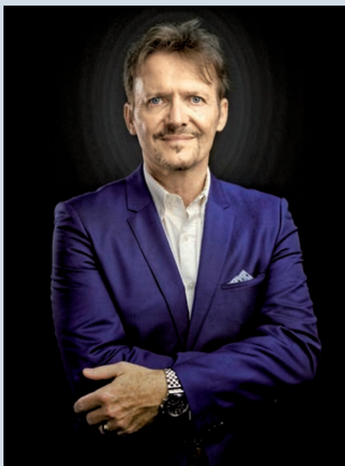
Seit September 2024 in München im Amt: der Schweizerische Generalkonsul Eros Robbiani

Vor allem in meinen vorherigen Posten in Australien wie auch in Kanada hatte ich viel mit der Export- und Standortförderung zu tun. Die wirtschaftlichen Beziehungen sind für mich ein sehr spannendes und wichtiges Thema, das auch bei meinen neuen Aufgaben im Mittelpunkt steht. Heutzutage gilt: Wer Wirtschaft sagt – insbesondere für ein Land wie die Schweiz –, sagt auch Innovation und Forschung. Ich sehe mit grossem Interesse, dass auch im Bereich des wissenschaftlichen Austauschs die Beziehungen zwischen der Schweiz und Bayern eng verflochten sind.