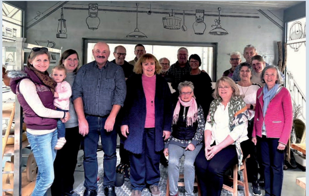
Mitten in Münster produziert die Hafenkäserei Biokäse: Das Schweizer Treffen Münster besuchte die Schaukäserei.

Im Anschluss an den Film durften die Gäste die Vielfalt der Käseproduktion direkt erleben. In einer ausgiebigen Verkostung wurden verschiedene Käsesorten serviert – von mild bis würzig –, begleitet von einer Auswahl köstlicher Saucen, die den Geschmack des jeweiligen Käses perfekt ergänzten. Um das Geschmackserlebnis abzurunden, gab es dazu Finne-Bier, ein lokaler Gerstensaft, der hervorragend zu den Käsesorten passte.