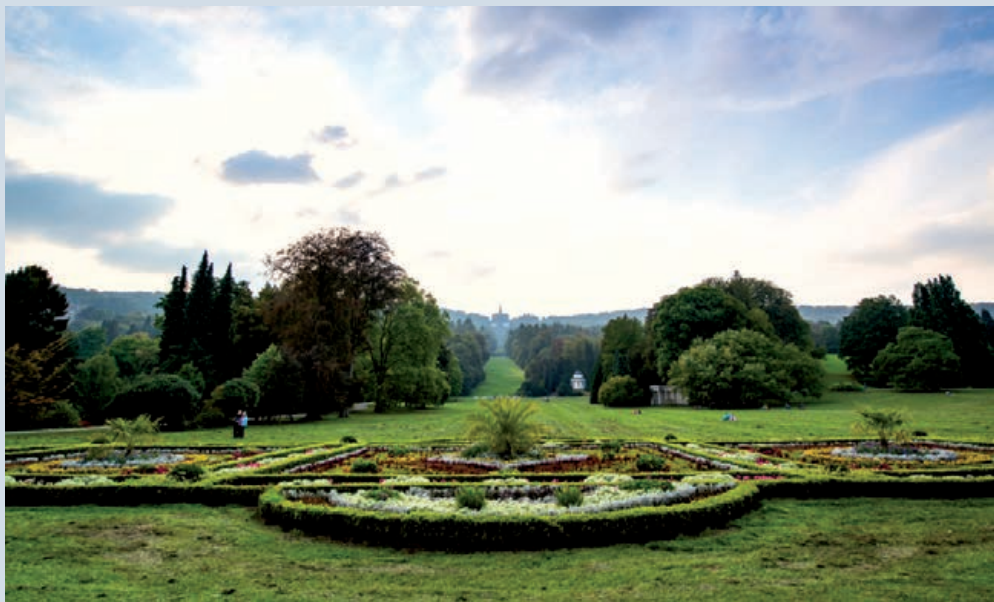
Die Schlosswiese und in der Ferne der über acht Meter grosse Herkules: Erkunden Sie den Bergpark und das Schloss Wilhelmshöhe, in dessen Nähe auch der Tagungsort liegt.

In diesem Jahr treffen sich Schweizer und Schweizerinnen am 30. und 31. Mai in Kassel zur Konferenz der Auslandschweizer-Organisation (ASO) Deutschland. Kommen Sie mit uns zum Mittelpunkt Deutschlands und zu einem besonderen Ort zwischen Geschichte und Kunst.