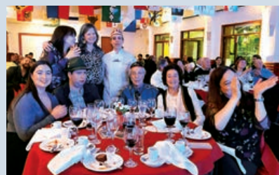
Socios y amigos del Club Suizo