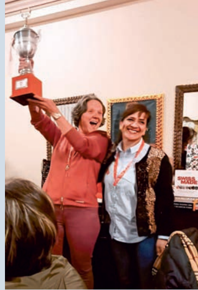
Ganadora del Trofeo del Jass