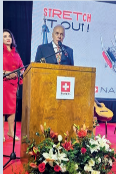
El Embajador de Suiza se dirige a los presentes