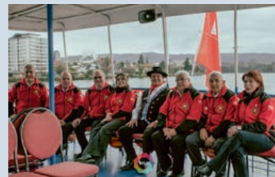
Integrantes de la Sexta Bomba Suiza de Río Bueno