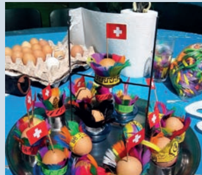
Huevos de Pascua decorados