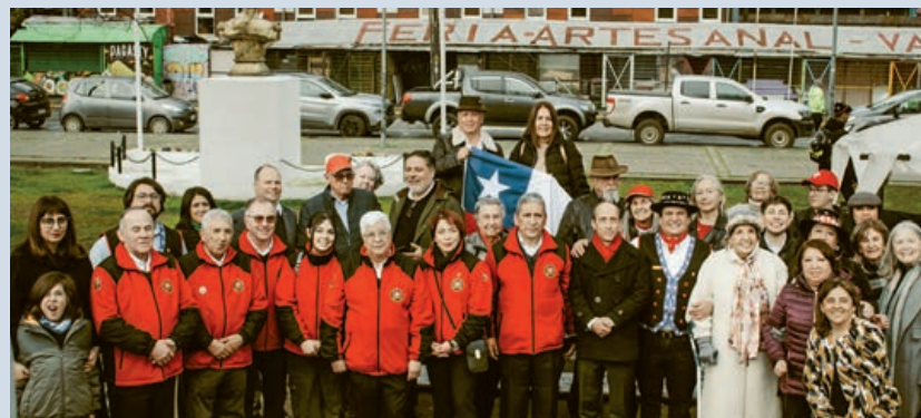
Participantes de la celebración del 1° de agosto

Club Suizo de Temuco, representantes del Club Suizo de Osorno y de la localidad Lacustre de Villarrica, socios del Club Suizo de Valdivia, compatriotas