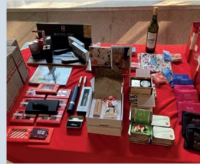
Artículos suizos para los asistentes