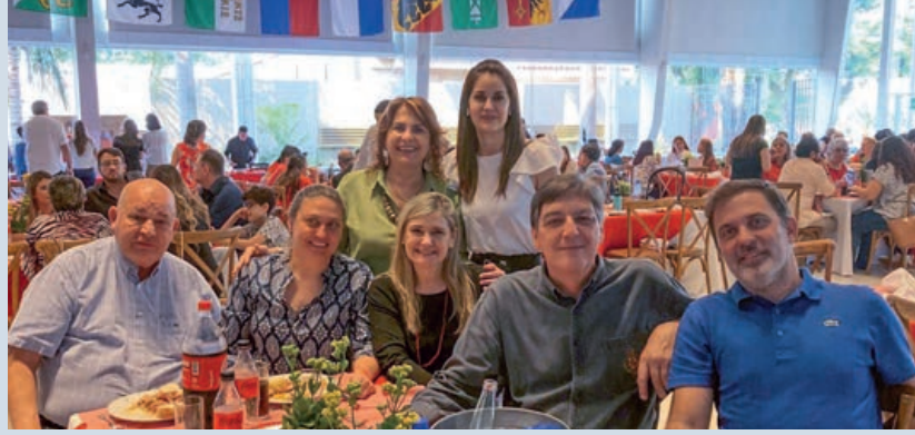
Asistentes al almuerzo

Durante el almuerzo de celebración realizado en Asunción, se sirvie-