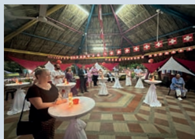
Un encuentro lleno de tradición se vivió en Cartagena