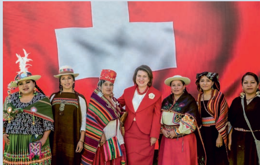
Sra. Embajadora con el grupo de Música Folclórica Inalmama Sagrada Coca

La Embajadora cerró el acto oficial con un brindis y la entrega de una placa en conmemoración de la joya arquitectónica del edificio de la Embajada de Suiza, construido en 2003 y que recibió el Premio de Cultura de la ciudad La Paz en el mismo año. Su mensaje: “Nuestra dinámica de coope-