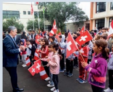
Consejero Federal Ignazio Cassis con los alumnos del Colegio Pestalozzi

Ignacio Cassis también participó en la inauguración de una exposición que celebra el 140 aniversario de las relaciones diplomáticas entre Suiza y Perú. En la noche, la comunidad suiza y las autoridades locales se reunieron en un gran evento en la residencia del Embajador