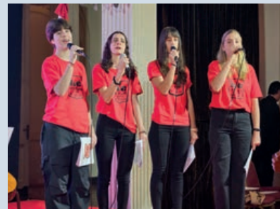
Alumnos del instituto Línea Cuchilla en la interpretación de los himnos nacionales de Argentina y Suiza