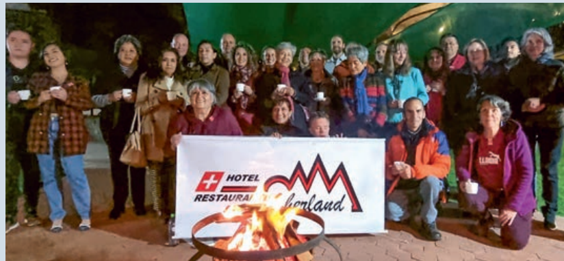
Festejo 1° de agosto