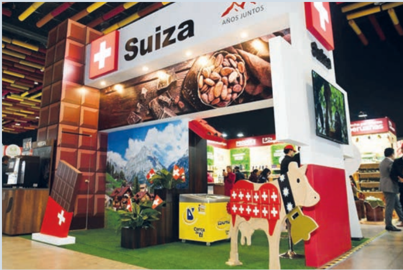
Salón del Cacao y del Chocolate

Suiza fue el país invitado en la 15ª edición del Salón del Cacao y del Chocolate, el principal evento de este sector en Perú, que cuenta con el Salón del Chocolate de París como socio estratégico.