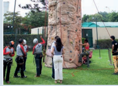
Pared de escalada y demostración de la Asociación de Guías de Montaña

El respaldo generoso de empresas suizas y peruanas como Nestlé, QSI, Kuna, Tiyapuy, Aje, Casa Andina y Civa, contribuyó al éxito de esta celebración única, consolidándola como un hito cultural y social en el calendario de eventos de Lima.