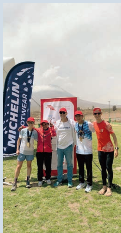
Atletas suizos y peruanos en la carrera Misti Sky Race 2023 en Arequipa, Perú