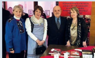
Presentación de los libros del Taller Literario

desarrolló este festejo que contó con presentaciones artísticas, entretenidos bingos y diversos stands de comida suiza con las tradicionales salchichas y raclette.