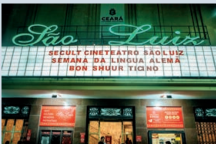
Cine teatro São Luís