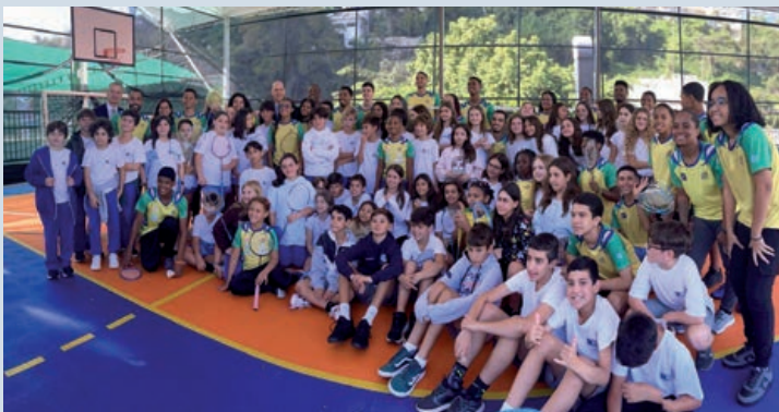
Alunos da escola SIS junto com atletas da Associação Miratus

Inauguração da nova quadra esportiva na Escola Suíça com a participação da Miratus de Badminton