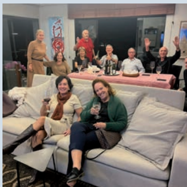
Comemoração do Dia Nacional da Suíça