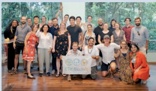
Grupo ETH BiodivX no palco do evento celebrando o final da competição

BiodivX, apresenta a exposição “Amazônia Mapeada: Imagens e Sons do DNA Ambiental.” Este projeto inovador une ciência, cultura e arte para destacar a urgência de preservar a biodiversidade e mitigar as mudanças climáticas.