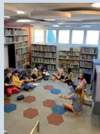
Crianças na biblioteca

No 4º e no 5º ano, a habilidade leitora é desenvolvida na roda de leitura, momento em que cada aluno compartilha