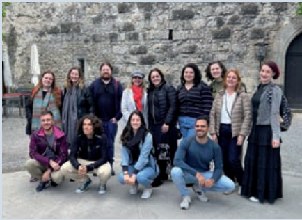
Professores participantes do job shadowing

Job shadowing é um termo da língua inglesa usado para descrever uma prática comum em muitos países que permite a um estudante universitário ou profissional explorar determinados aspectos de seu campo de trabalho. A ideia é que a pessoa acompanhe o dia a dia de outro profissional, como se fosse uma sombra [shadow].