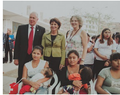
Visita presidencial en San Juan de Lurigancho