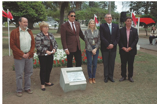
Inauguración Espacio del Hermanamiento Plaza San Martín