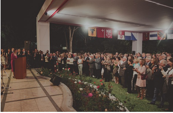
La Sra. Doris Leuthard dirige su mensaje a la comunidad suiza