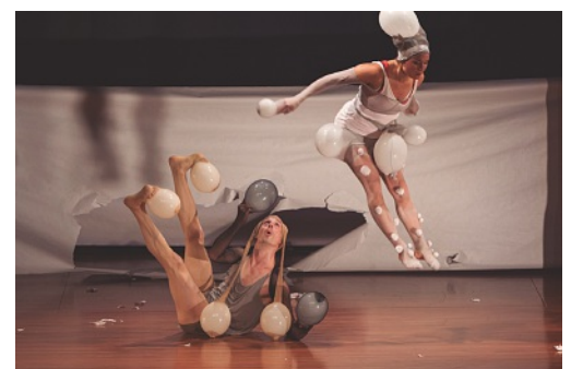
Zick-Zack-Puff en acción