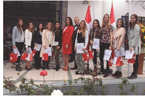
Jóvenes ciudadanas con el Sr. Embajador y su esposa

El 5 de octubre se presentó la obra Zick-Zack-