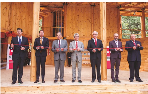
Los CEOs de las empresas patrocinadoras inauguran la Casa de Suiza México 2016

concluyó que “...además de ser el octavo inversionista directo más importante en México, Suiza es un socio privilegiado en materia de negocios y política multilateral. La Casa de Suiza México 2016 fue el foro ideal para una mayor profundización de la cooperación entre ambos países”.