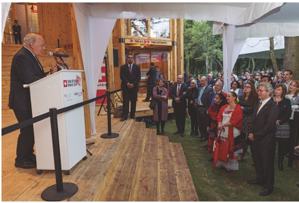
El Presidente Johann Schneider-Ammann en la Casa de Suiza dirigiendo sus palabras a la comunidad suiza.