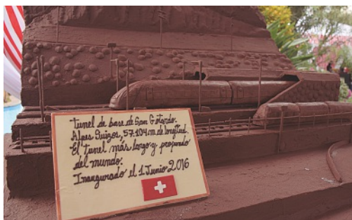
Túnel San Gotardo en chocolate

(ESTHER-MARIE MERZ- AGREGADA CULTURAL Y DE PRENSA DE LA EMBAJADA DE SUIZA EN LIMA/PERÚ)