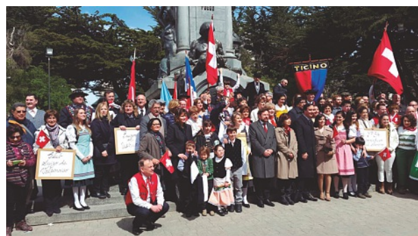
Autoridades y participantes del desfile en la Plaza Muñoz Gamero

Finalizado el desfile todos los participantes se convocaron en el monumento de la Plaza Muñoz Gamero para