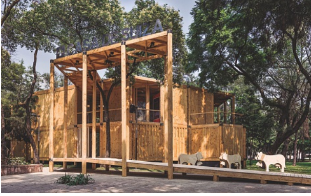
Casa de Suiza México 2016 en el Bosque de Chapultepec