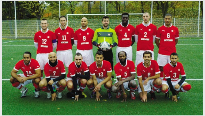
Les Suisses de Paris demi-finalistes de la Coupe de Paris