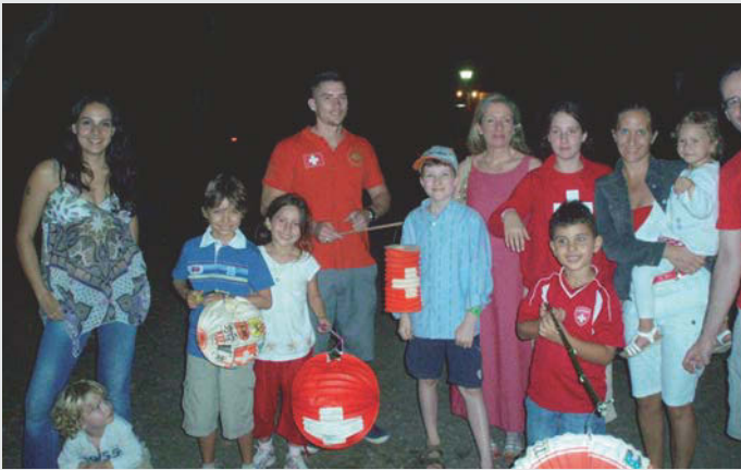
Los niños con sus faroles. En el centro, la Sra. Embajadora

amistades con los diferentes pueblos. Somos representantes en muchas ocasiones y no subestimamos nuestro aporte para un buen entendimiento entre culturas tan diferentes.