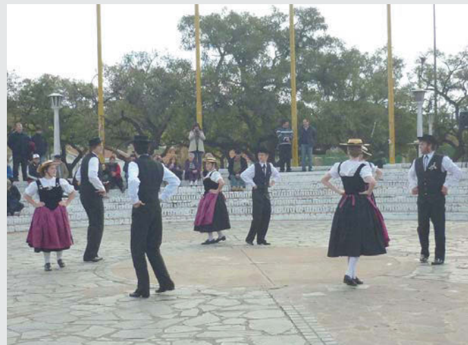
Cuerpo de Baile "Encantos Alpinos"

En su sede de la calle Lavalle 115 en la pintoresca ciudad de