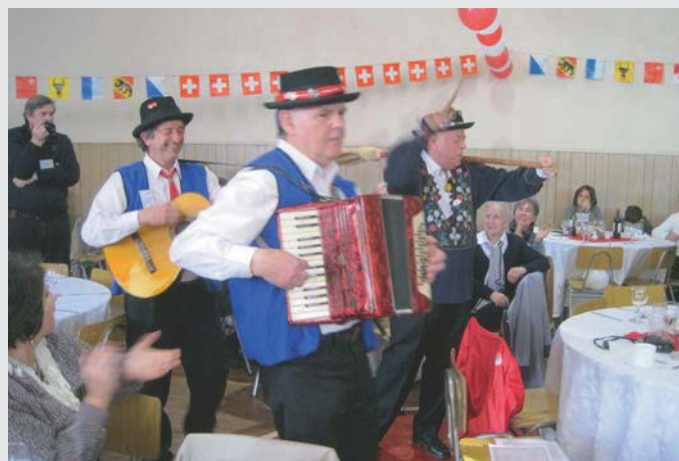
La música alegró el encuentro en Traiguén.

Rousseau fue filósofo, educador, autor, músico y naturalista a la vez, fue también revolucionario y uno de los padres del pensamiento democrático moderno. En una de sus obras llamada El contrato social, aborda muchos de los conceptos que