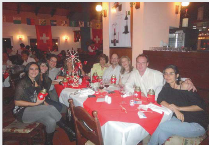
Algunos comensales. Sobre la mesa, el molino construido para la competencia

Con las vibrantes palabras grabadas de la Sra. Presidente del Consejo Federal y el tradicional brindis colectivo, este año se inició la reunión del 1º de agosto, a las 19 hs. Acto seguido, los participantes tuvieron la oportunidad de deleitar sus paladares con una succulenta cena a cargo del chef del Chalet