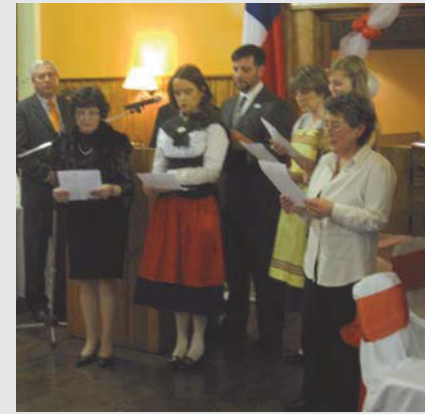
Momento del Himno Suizo

El sábado 4 de agosto se celebró la Fiesta Nacional Suiza en los salones del Club Suizo de Magallanes; asistieron cerca de 150 personas entre socios del Club, descendientes de suizos friburgueses y amigos de la colonia suiza. La celebración comenzó en el Himno Nacional de Chile y a continuación el Himno Nacional de Suiza, que fue acompañado en coro por integrantes del Círculo Suizo.