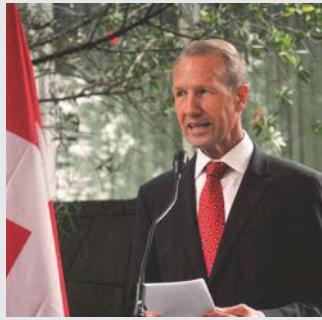
Sr. Rudolf Werner Knoblauch, Embajador de Suiza en México

guiremos con las festividades en el marco de una semana suiza en la Ciudad de México. Del 22 al 27 de octubre, el Zócalo se pintará de rojo y blanco. Con la colaboración del gobierno del Distrito Federal y de las empresas suizas en México, se está preparando esta semana cuya meta es crear más intercambio cultural, culinario, científico, comercial y político entre las dos naciones”.