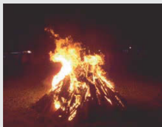
La gran fogata

Los deseos de los niños también se cumplieron con satisfacción: una gran fogata (aunque algunos sufrimos picaduras de hormigas), una caminata con los faroles, cuando ya nos olvidamos de la picazón, canciones y por fin unos lindos fuegos artificiales. Este punto del programa fue apreciado por todos. Después de recoger sus premios de la tómbola y de la música que empezó sonar en vivo, los padres con niños pequeños se retiraron y siguió la parte de los ani-