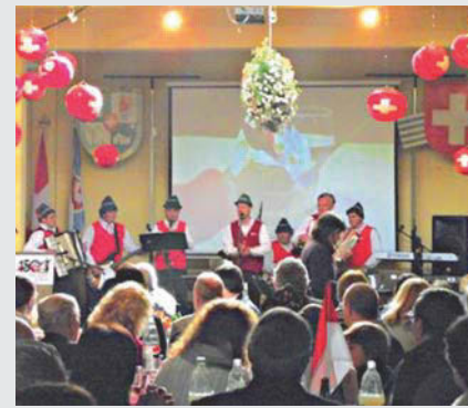
Centro Helvético-5 de agosto

El domingo 5 de agosto, en el marco de los 150 años de la Colonia Suiza y los 721 años de la Confederación Helvética, se realizó el Acto Inauguración de las