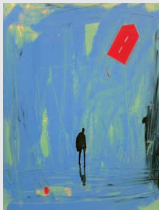
Soir d'ivresse (souvenir de la maison rouge)

Société des artistes visuels professionnels suisses en France 17 Rue Duquay Trouin. 75006 Paris. lemeslif.architecte@wanadoo.fr www.galerie-suisse.net. Président : Serge Lemeslif.