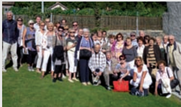
Le groupe devant le Musée suisse de l'orgue à Roche