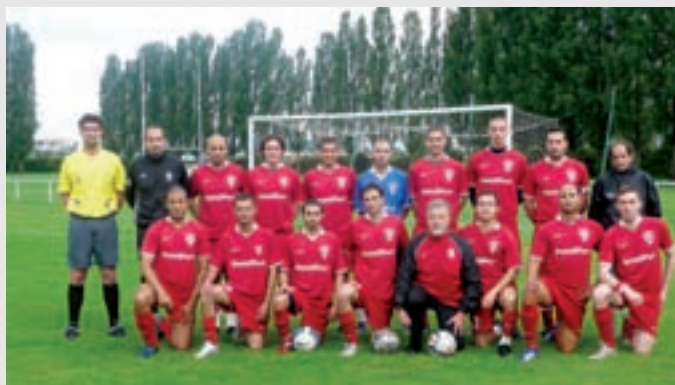
L'équipe Fanion de la 100 ème saison de l'USSP