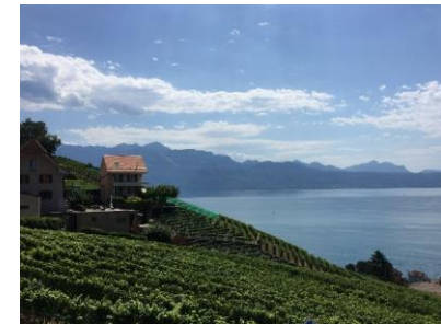
Touristisches Programm 2019, Lavaux