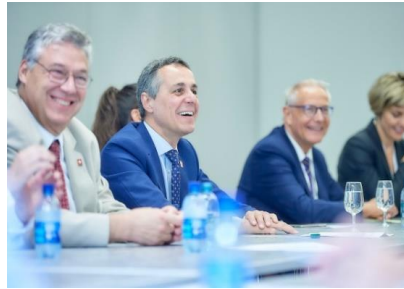
Filippo Lombardi & Ignazio Cassis