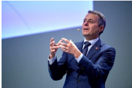
Ignazio Cassis, Bundesrat