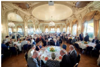
Abschlussabend 2019, Montreux