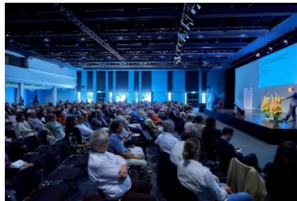
Plenarversammlung 2019, Montreux