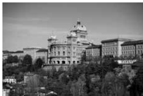
Le Palais fédéral

Pour l'OSE, l'élaboration d'une «Loi fédérale sur les personnes et les institutions suisses à l'étranger» représente sans aucun doute le projet le plus important depuis longtemps sur le plan stratégique. Compte tenu de la fragmentation législative et institutionnelle et