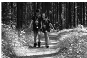
Camp de vacances à Madetswil (ZH)

A la fin 2013, 364 enfants suisses de l'étranger ont profité des offres de séjour de la fondation pour les enfants suisses à l'étranger. Ce nombre réjouissant de participants n'a pu être atteint que grâce à l'engagement des membres des comités cantonaux et du Conseil de fondation, des monitrices et des moniteurs et de tous les autres participants. Nous tenons à les remercier tous chaleureusement.