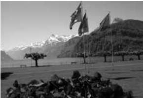
Place des Suisses de l'étranger, Brunnen

Le projet «Tremplin», l'idée d'un Suisse de l'étranger «Walk of Fame», le réaménagement de la rive du lac à Brunnen ainsi que le renouvellement du plan de zones de construction Ingenbohl-Brunnen sont les principaux points de l'ordre du jour traités par le Conseil de fondation Place des Suisses de l'étranger Brunnen, qui s'est réuni pas moins de cinq fois cette année.