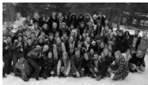
Camp d'hiver pour Suisses de l'étranger

Quelque 300 adolescents ont choisi en 2013 une offre de l'OSE pour les jeunes. Les participants ont passé des vacances en Suisse, obtenu des conseils ou suivi une formation. L'OSE offre aux jeunes citoyens et citoyennes