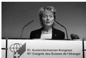
La conseillère fédérale Eveline Widmer-Schlumpf à Davos

L'une des grandes tâches annuelles du département Communications & Marketing est l'organisation du Congrès des Suisses de l'étranger. Celui-ci doit permettre à nos compatriotes expatriés de mieux faire entendre leur voix en Suisse. Il se veut une plate-forme