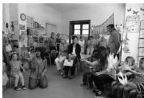
L'école suisse de Catane

Les 17 écoles suisses à l'étranger proposent une formation scolaire de qualité supérieure sur le modèle suisse. Elles sont reconnues et subventionnées par la Confédération. Là où il n'y a pas d'écoles suisses, les parents suisses peuvent, si le nombre d'enfants suisses est suffisant, faire en sorte que des enseignants suisses subventionnés complètent le quotidien scolaire dans des écoles d'États voisins avec des notions d'enseignement suisse. En outre, la Confédération fournit, également sur demande de parents suisses, des aides financières pour des cours sur la Suisse et les langues nationales ainsi que pour du matériel de formation.