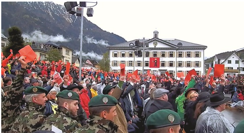
Die Glarner Landsgemeinde versammelt sich alljährlich unter freiem Himmel am ersten Sonntag im Mai auf dem Zaunplatz in Glarus