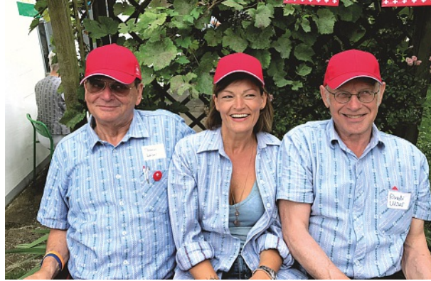
Mittelhessen in guter Laune