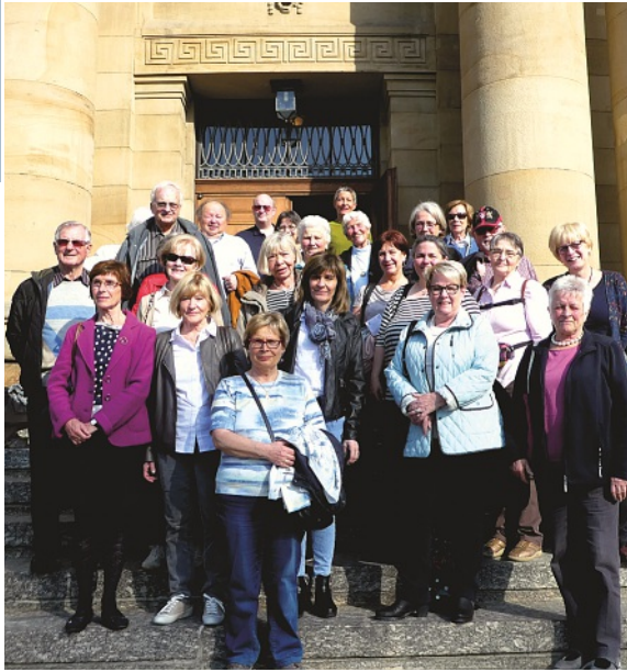
Lust auf Theater: Am 28. März besuchten 26 Mitglieder der Schweizer Gesellschaft Stuttgart das Staatstheater Stuttgart. Es gab einen hochinteressanten Einblick, über die Vorgänge hinter den Kulissen.