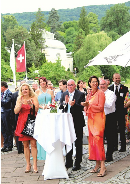
Festlicher Sektempfang in Bad Wilhelmshöhe Rechts im Bild Botschafterin Christine Schraner Burgener