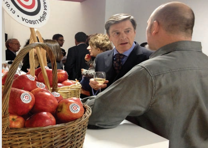
Botschafter Lorenzo Schnyder von Wartensee (links) mit Sylvain Grasset. L'Ambassadeur Lorenzo Schnyder von Wartensee (gauche) avec Sylvain Grasset.

La rénovation de la «Casa Suíça» à Lisbonne a duré trois ans: à présent, le bâtiment brille de toute sa nouvelle splendeur à la rue Silva Carvalho 152. La réouverture a été fêtée le 26 octobre 2013.