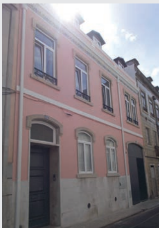
Fassade der Casa Suíça. Façade de la Maison Suisse.

Pour qui souhaite plus d'espace, un bureau de 50m 2 au second étage est disponible ainsi que deux pièces voisines de respectivement 7,5 et 13 m 2 , le tout pour 694,39€. Au même étage se trouve encore un petit bureau de 11m 2 pour 124,08 €. Le bureau d'architecture Matelier a été choisi pour la réalisation du projet: Deux de ses 6 architectes ont été particulièrement intéressés: Frederico Santos et Sylvain Grasset, président et vice-président du Club Suisse. AK/BP info@clubsuisse-pt.com