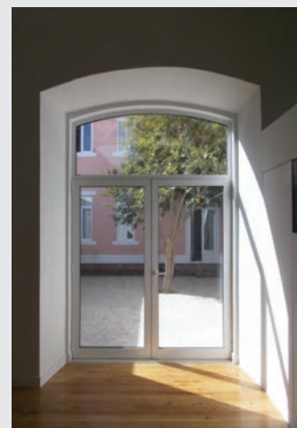
Viel natürliche Materialien: Holz und Stein in der «Casa Suíça». Beaucoup du matériel naturel: Bois et pierre dans la «Casa Suíça».