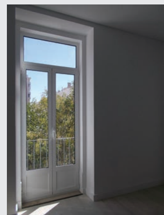
Büro 1 D mit direktem Ausgang zum Patio. Le bureau 1D avec la sortie directe sur le patio.

Aperçu du 1er étage : à gauche en haut le bureau 1 D.