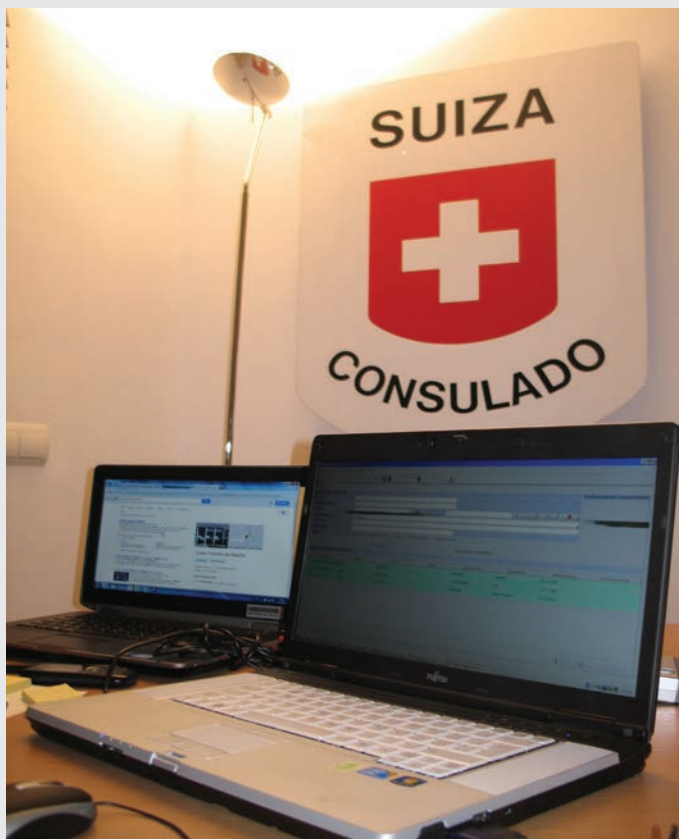
Eine der fünf mobilen Biometrie-Stationen des EDA auf Mallorca - während fünf Tagen wurde damit das Honorarkonsulat zu einem «richtigen» Konsulat.