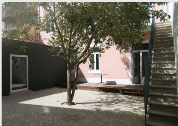
Oase in der Grosstadt Lissabon: Der begrünte Innenhof der «Casa Suíça». Oasis dans la metropole de Lisbonne: La cour intérieure verte de la Casa Suíça.