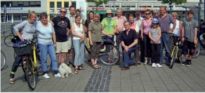
Schweizer Velofahrer kurz vor dem Start in Münster.