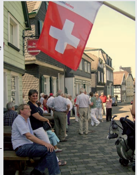
Unübersehbar: Schweizer in der Altstadt von Schwelm