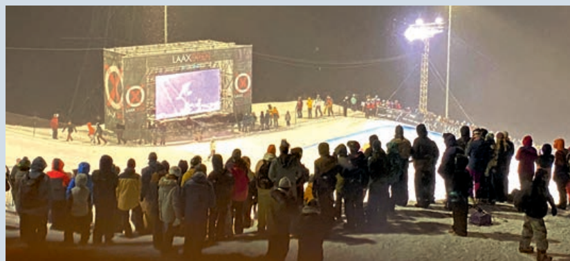
Auf der Videoleinwand sahen die Zuschauer den gesamten Lauf der Teilnehmenden