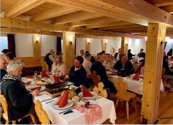
Ein gemütlicher Abend in stimmungsvollem Ambiente

Um 18.30 Uhr traf man sich im schön dekorierten und vorbereiteten Veranstaltungsraum im Bangshof Ruggell. Der Abend fand unter dem Motto «Nacht in Tracht» statt und dementsprechend hatten sich fast alle Anwesenden in Dirndl oder Tracht schön gemacht, um dem Motto gerecht zu werden. Ebenfalls gab es für die passend gekleideten Teilnehmer einen Preisnachlass bei den Kosten für das Raclette.