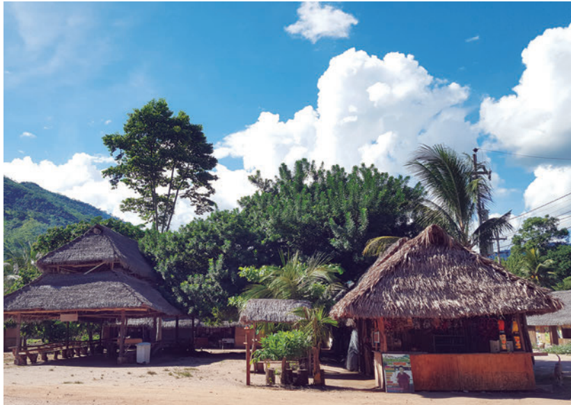
Comunidad nativa Asháninka "Pampa Michi"

¿Cómo es esta región? Hay que imaginarse un bosque tropical -con altas temperaturas, caudalosos ríos, y una enorme diversidad de flora y fauna-, pero ubicado entre grandes cerros a más de 1000 metros de altura. Esta mezcla entre la selva amazónica y los Andes peruanos, crea paisajes y panoramas únicos. Gracias a su ubicación geográfica en el centro del Perú, durante fechas festivas como los carnavales, la Selva Central recibe una enorme cantidad de turistas que llegan desde diferentes partes del país para pasar algunos días y disfrutar de la naturaleza. La mayor parte de la población autóctona se concentra en las localidades de La Merced, Satipo o Pichanaki, de aproximadamente 30 mil habitantes cada