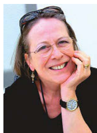
MONIKA UWER-ZÜRCHER REDAKTION DEUTSCHLAND

Elegante Fassaden, grosse, repräsentative Wohnungen, Vorgärten, grüne Plätze und ein eigener U-Bahnhof machten das Viertel aus. Zahlreiche Strassen erhielten die Namen bayrischer Städte. Die Gebäude bekamen verzierte Türmchen, gestufte Giebel und repräsentative Eingänge.