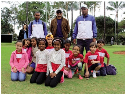
Crianças que participaram da Copa Suíça

O evento, tanto para os participantes adultos como para as crianças, foi um grande sucesso, e a Embaixada da Suíça espera poder voltar em breve com uma nova edição.