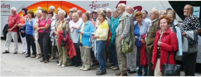
Ausflug nach Kaprun

wunderschöne Natur und der atemberaubende Blick ins Tal verborgen. Nach der Stärkung im Bergrestaurant Mooserboden traten wir die Heimreise durch das schöne Salzburger Land an.