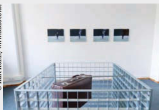
Roman Signer; Koffer; 2012; Metallgitter, Metallstange, Koffer; Courtesy Galerie Martin Janda, Wien