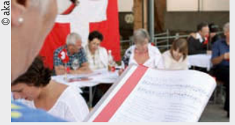
Neben der Nationalhymne wird auch humoristisches Liedgut angestimmt, so von Liedermacher Mani Matter .

Es ist ein Abend, an dem ich mich ohne viel Vorstellungsvormögen fast schon auf Schweizer Boden wähne. Dies, obwohl ich von einer Hausruckviertler Anhöhe den Schatten beim Längerwerden zuschauen und nicht von der Schweizer Rütliwiese aus. Doch wie kommt diese helvetische Exklave so plötzlich nach Oberösterreich ? Schweizerflaggen und „ Kantonsfähnli “ säumen den Ort der Handlung. Schweizerländler orgelt aus dem Lautsprecher , Holz fürs Feuer ist aufgeschichtet und Liederhefte mit eidgenössischen Evergreens liegen bereit. So wird der 1. August, der Nationalfeiertag der Schweiz, begangen – auch in der Ferne.