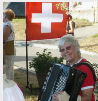
Musikalische Begleitung der 1. August Feier

Inzwischen gab es auch zwei „Plauder-Träffs“ in der Villa Lido