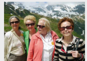
Kaprun - 4 Reisetilnehmerinnen

... dass wir in den Regionalnachrichten etwas von unserem Verein lesen konnten. Aber wir konnten inzwischen einen wunderschönen Sommer geniessen, der wiederum wohl für fast alle von uns viel zu schnell vergangen ist. Der Frühnebel und die kühleren Nächte kündigen den Kärntner Herbst an. Doch auch diese Jahreszeit hat sehr schöne Seiten, wenn wir mit offenen Augen durch die Natur wandern. Mit offenen Augen haben wir auch den diesjährigen Ausflug am 22.6. nach Kaprun genossen.