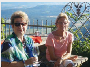
Wunderschöner Abend am Magdalensberg

Ca. 6 Wochen später trafen wir uns abermals in der «Hohe». Die 1.-August-Feier fand heuer am