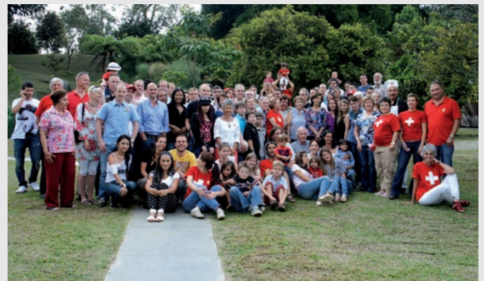
Foto del grupo durante el festejo en Colombia

La fiesta del 1° de agosto se celebró en Medellín con una nutrida asistencia. Más de un centenar de personas pasamos un día campestre y soleado degustando la típica comida suiza: ensalada de papas, ensalada de verduras, salchichas y postre. Varias familias aportaron su esfuerzo para la preparación de la comida y la atención del buffet y las bebidas, para que todo el grupo disfrute de esta ocasión