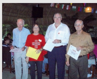
Reconocimiento a los expresidentes

Entre los asistentes, además del Sr. Embajador de Suiza en