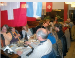
Vista parcial de la cena