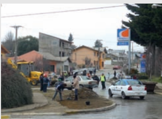
La solidaridad en marcha.

El informe finaliza: "De esta manera sentimos que estamos cumpliendo con lo que nos hemos propuesto y lo seguiremos haciendo con la colaboración de nuestros asociados".