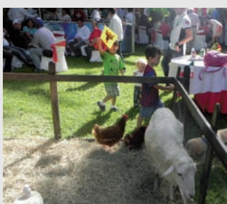
Granja de contacto

El ambiente musical respondió al sonido de los cornos con la cátedra de corno de la Escuela Mozarteum Caracas, recordando