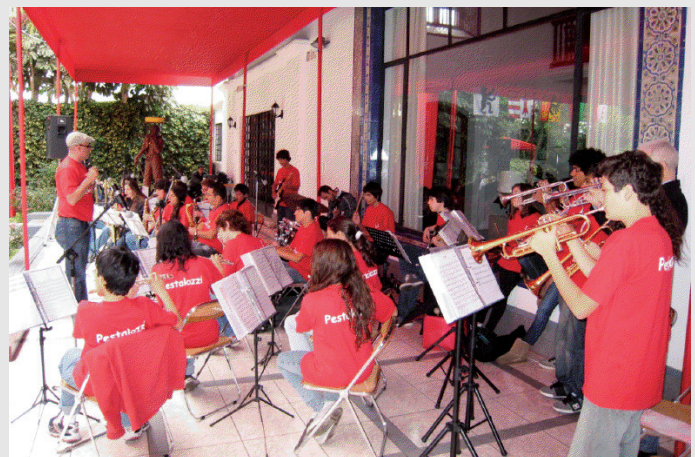
Orquesta del Colegio Pestalozzi

La celebración del 1° de agosto empezó con un cordial saludo de la Sra. Embajadora Anne-Pascale Krauer Müller dirigido a la colonia suiza en el Perú, a través de Radio Filarmónica, radio de música clásica con difusión nacional. Fue seguido de un programa musical suizo a lo largo del día. En la tarde, un colaborador de la Embajada pre-