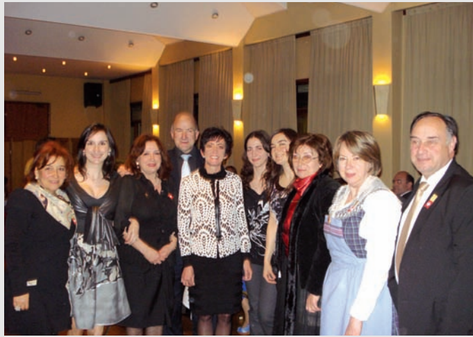
En el centro, la Sra. Embajadora, acompañada por algunos asistentes