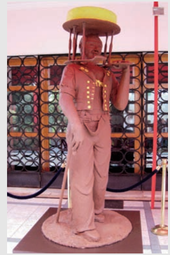
Escultura en chocolate