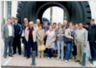
Le groupe devant le pneu le plus grand du monde exposé au Musée Michelin

Le 29 mai dernier nous avons eu beaucoup de plaisir à visiter Vulcania. L'après-midi était consacrée aux multiples attractions de ce parc, ainsi qu'à la visite du volcan Lemptegy à ciel ouvert en petit train. Le dîner du samedi soir était très animé puisqu'il avait lieu devant la place où était retransmise la finale du TOP 14 de Rugby entre Clermont et Perpignan. La nuit fut bruyante puisque Clermont est sorti vainqueur ! Le lendemain c'était la visite du musée Michelin avant de se rendre à Thiers pour un déjeuner cabaret. Voyage à la fois instructif, amical et très dépayssant qui a ravi tous les participants.