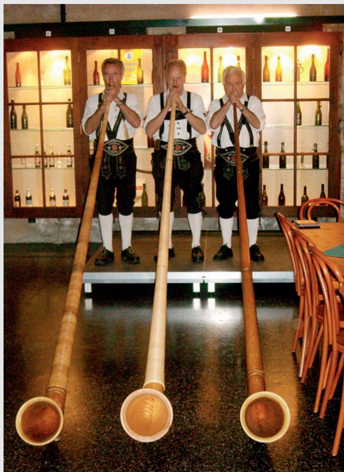
Auch im Ausland gehören Alphornbläser zur 1. Augustfeier!