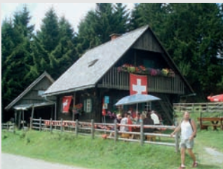
Dreieckhütte/Dreieckalm, Seehöhe: 1.522 Meter