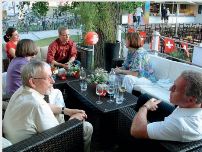
Die Bundesfeier fand wieder am Herrmannstrand (ehemaliger Swissbeach) statt