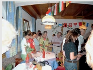
Wir singen den Psalm