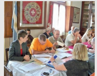
Reunión en la Sociedad Suiza de Baradero, Pcia. de Buenos Aires

El 6 de junio, la Federación se reunió en la Sociedad Suiza "Helvecia" de San Jerónimo Norte, coincidiendo con la Fiesta Na-