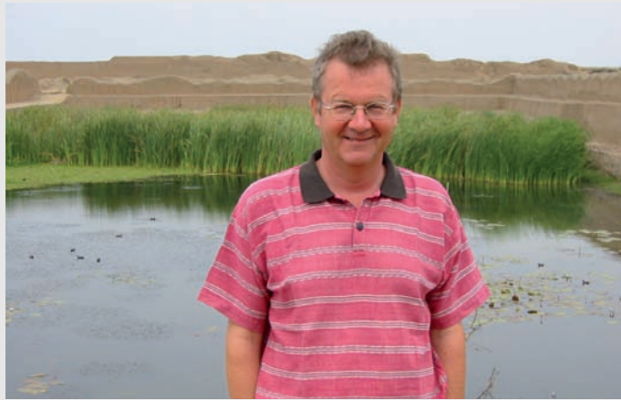
Sitio arqueológico Chan Chan, en el Norte del Perú

En el idioma alemán existe la expresión "¿Te mordió el mono?" que significa estar loco. Siempre pensé que sólo era una metáfora, que en realidad los monos no muerden. Me equivoqué. En Bolivia fui testigo de un mordisco real y no metafórico. La pobre víctima fue una señora con cierta edad y mucha dignidad; me pareció simpática y para nada, loca. Pues perdió la mitad