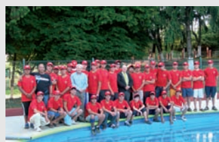
Grupo Bailes Suizos del Liceo La Providencia