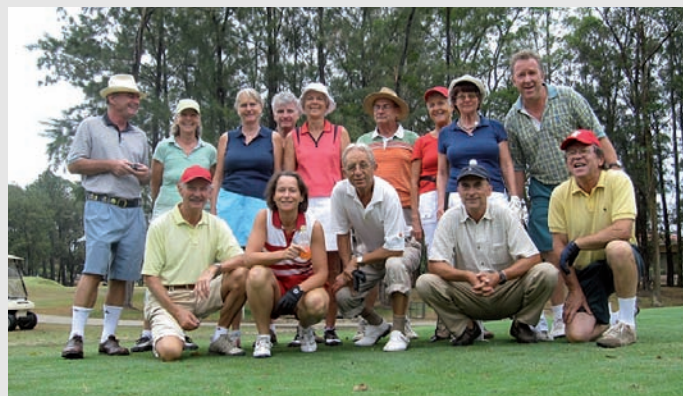
Participantes del torneo de golf