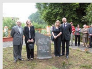
Monolito entregado al Liceo Suizo La Providencia

Fue un Encuentro de conocimiento, fortalecimiento de lazos de amistad, fraternidad y claro compromiso con el futuro.